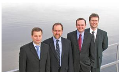
Partnerne i NorWatt AS

Totalt sett mener vi derfor at NorWatt Energy Invest er godt posisjonert for å gi en positiv utvikling i tiden framover, og målet er fortsatt 12 % i gjennomsnittlig årlig avkastning.